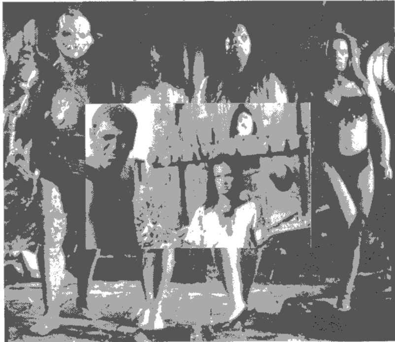
Juliette Lewis und George Clooney inmitten von neumodischen Vampiren

Das Ganze beginnt wie die x-te Version des beliebten Serienmörderroadmoviemaniacfilms, sehr liebevoll und ebendrum sehr zynisch, bis denn die gute Pfarrersfamilie (Vater Harvey Keitel und Tochter Juliette Lewis) die Killer über die Grenze und in eine übelste Spelunke bringt, wo sich der Film in einen Vampirfilm verwandelt. Wobei Vampire hier nicht grade aristokratische Transsylvaner sind, sondern eher eine Art Alternativbetrieb, der es sich in der Nische 'Trucker und Biker aussaugen' gemütlich gemacht hat. Der Rest ist ein munteres Mutieren, Beißen, wieder Mutieren, Metzeln, sonstwie Gemeinsein und Anti-Vampirwaffen Erfinden („Was wissen wir eigentlich über Vamire?“)