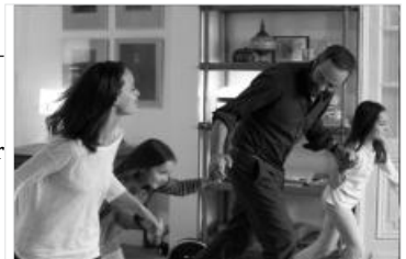
Die Ökonomie der Liebe