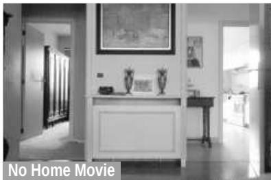
No Home Movie