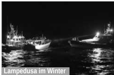
Lampedusa im Winter