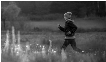
All for my mother