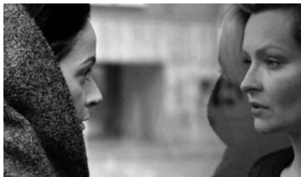
I am Ren

Achtung Berlin Das Festival um Film aus und über Berlin findet nun vom 16. - 20.9 statt und zum zweiten Mal auch bei uns.